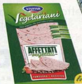
Affettati vegetali al pomodoro e basilico di Stuffer (da 1,99 €).