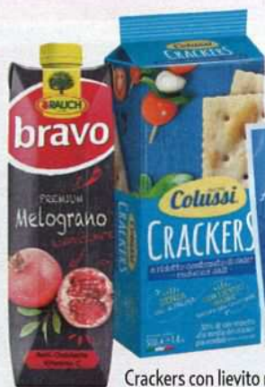
Crackers con lievito madre a ridotto contenuto di sale e senza olio di palma di Colussi (1,49 €).