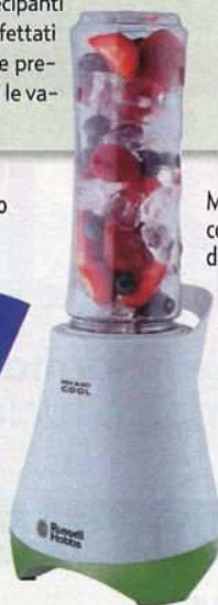
Mix and Go Cool, frullatore con bicchiere da passeggio, di Russell Hobbs (41 €).