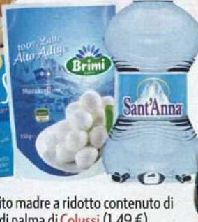
Acqua da 25 ml, con tappo push and pull, Sant'Anna Fonti di Vinadio (0,39 €).