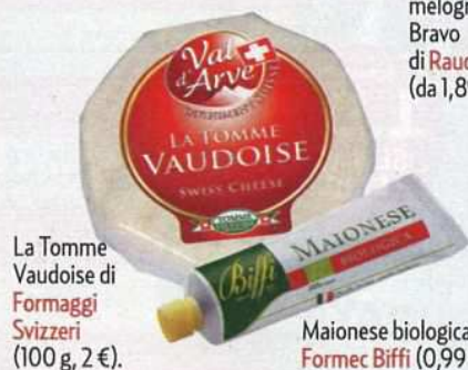
La Tomme Vaudoise di Formaggi Svizzeri (100 g, 2 €).