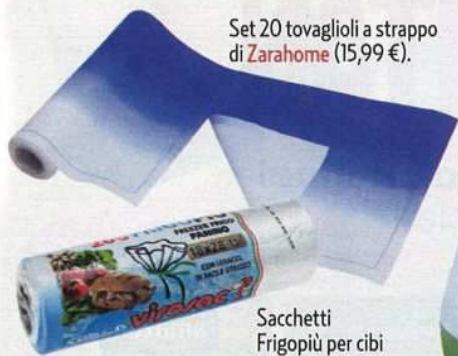
Set 20 tovaglioli a strappo di Zarahome (15,99 €).