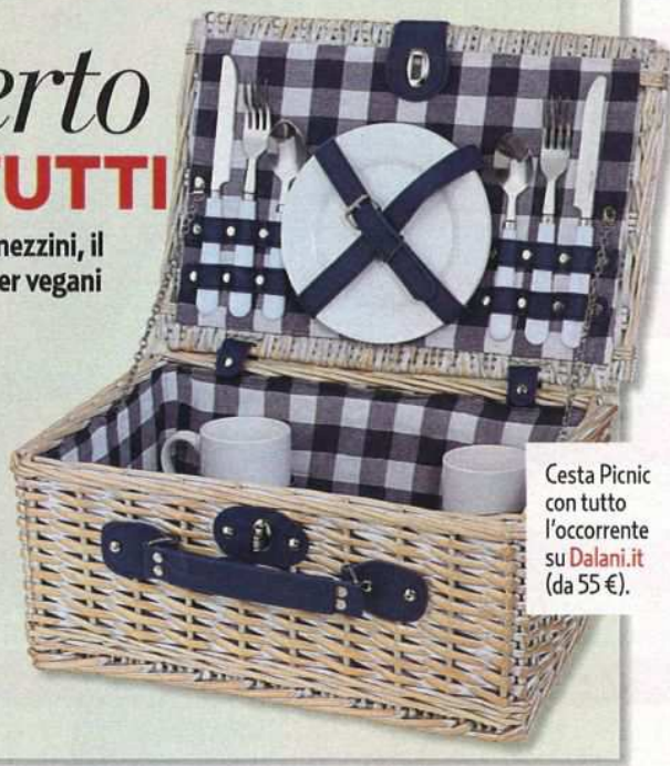
Cesta Picnic con tutto l'occorrente su Dalani.it (da 55 €).

B astano uno spazio verde lontano dal caos o un bel parco cittadino, un plaid, un cesto di vimini: l'incanto e la tranquillità di un picnic sono alla portata di tutti. Facciamolo almeno una volta d'estate, il picnic, per ritrovare certe sensazioni perdute e certi sapori dimenticati. Mi raccomando: equipaggiatevi di una tovaglia a quadretti, contenitori colorati e rotolo di tovaglioli in tessuto a strappo. Il menu da mettere nel cesto è vario, tante le proposte, anche di cibi pronti. Non possono mancare succhi di frutta e yogurt, le mozzarelline di latte vaccino o i golosi formaggi svizzeri per le insalate. E se tra i partecipanti ci sono vegetariani o vegani, ecco i nuovi affettati vegetali di Stuffer. Per chi invece preferisce preparare qualcosa di cucinato, indispensabili le vaschette con chiusura ermetica di Bama.