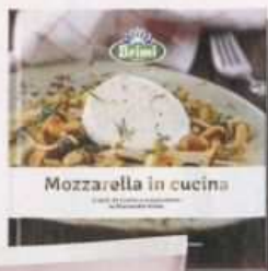
Mozzarella in cucina

La Mozzarella Light di Brimi , ottenuta dal latte fresco dell'Alto Adige, ha solo l'11% di grassi. E, per proporla in piatti sempre nuovi, si può acquistare il ricettario "Mozzarella in cucina" (su www.brimi.it ).